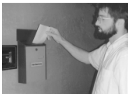
‘Traditionelles’ CarSharing bei der FAG: Einwerfen des Fahrtberichtes nach der Kfz-Nutzung.

Wir sind davon überzeugt, daß ein solches Mobilitätssystem, diese ‘Mobilität à la Carte’ und aus einer Hand, keine Wünsche offenläßt und die sogenannten ‘Autolosen’ genauso zufrieden sein werden wie die über 1000 Mitglieder des Car-Sharing in Südbaden, die nun schon seit 7 Jahren umweltbewußt mobil sind. Gut organisierte, umweltbewußte Mobilität bedeutet nicht weniger, sondern erheblich mehr Lebensqualität. Das stellen immer mehr Menschen fest.