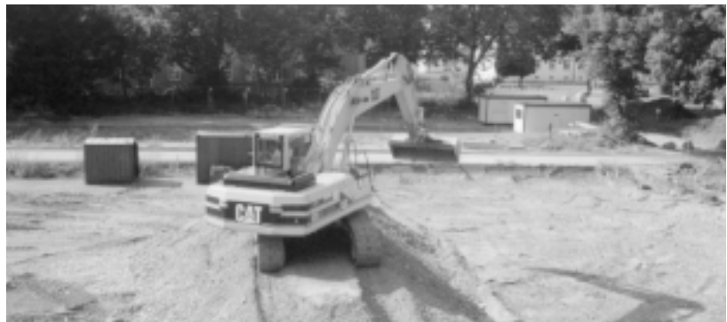
8.9.1998: Auf dem Grundstück der GENOVA sind jetzt die Bagger an der Reihe ...