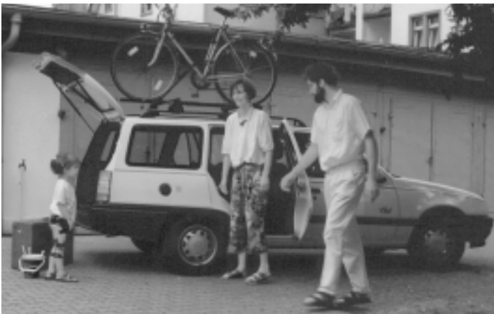
Auto-mobil ohne eigenes Auto: CarSharing macht's möglich