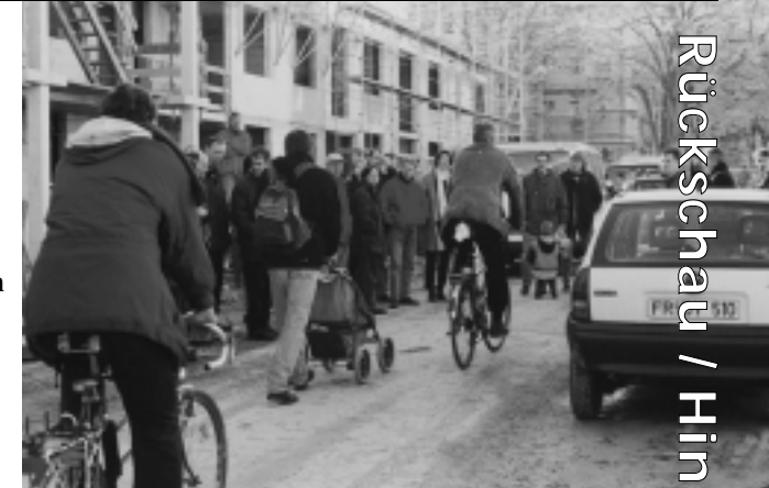
Eine Facette des LIFE-Projektes: der Wohnstraßenworkshop im Herbst 98

Viele weitere Einzelthemen könnten noch erwähnt werden, darunter z.B. das von Eva Luckenbach betreute Thema Abfallvermeidung oder die Bürgerbeteiligung bei der Planung der ersten Grünspange im Frühjahr 1999 gemeinsam mit dem Gartenamt und dem Büro UNArt. Die Konferenz StadtVisionen (vgl. Seite 4) sowie das Handbuch "Nachhaltige Stadtentwicklung beginnt im Quartier" waren weitere Highlights. Bezüglich weiterer Details sei auf den Abschlußbericht verwiesen, der ab April 2000 vorliegt.