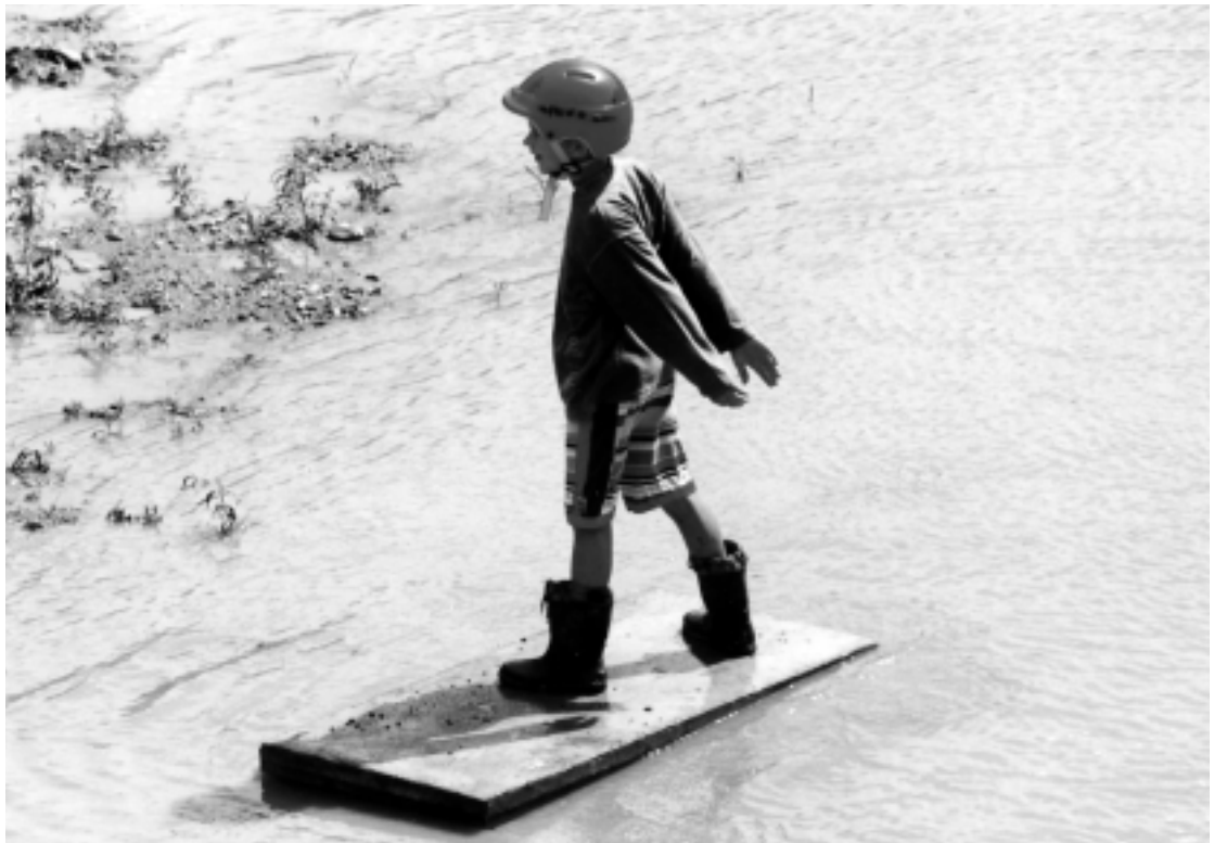
Guten Rutsch ins neue Jahrtausend! Aufgenommen von Jürgen Schneider auf dem Vaubangelände im Sommer 1999